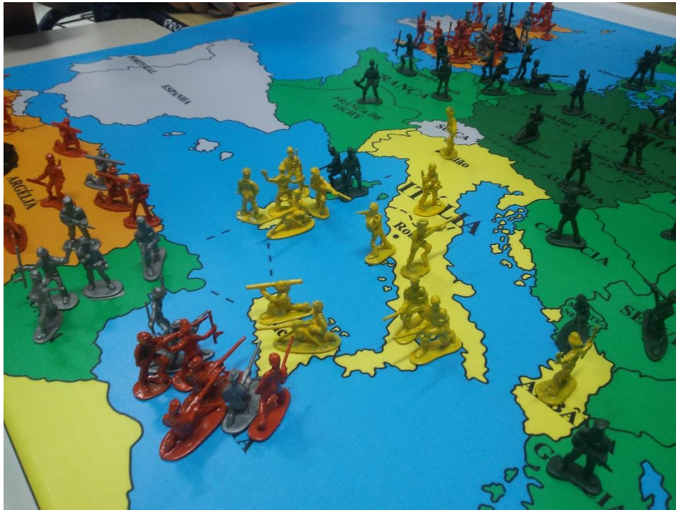
Imagem 8: Os Aliados prontos para a Operação Huskie, a invasão da Sicília.

A segunda questão, apesar de ter relação direta com a primeira, teve respostas mais sólidas. Curiosamente, na turma de 2018, o grupo que tinha dado a resposta mais confusa à primeira questão respondeu adequadamente a essa: “França, Croácia e Sérvia”. Os outros dois grupos responderam “Romênia, Bulgária e parte da União Soviética”. Percebe-se aí um desentendimento a respeito de países ocupados e aliados. Na turma de 2019, um dos grupos respondeu “Noruega, Dinamarca e França”, mas os outros dois também fizeram confusão. Um dos grupos incluiu os três países da resposta da primeira questão a diversos outros países, como Romênia e Hungria (que não foram ocupados, mas eram aliados), enquanto o outro grupo respondeu “Hungria, Finlândia e Polônia”.