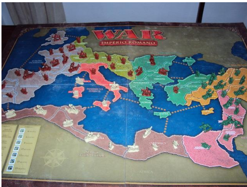
Imagem 3: War Império Romano.

A ideia de utilizar o tabuleiro de War Império Romano para reproduzir um cenário histórico real serviu de base para a criação do jogo desenvolvido no presente trabalho. Dois motivos justificam a escolha pela mudança de tema do jogo. Primeiramente, o tema é o mais conhecido e divulgado nos meios de comunicação quando se trata de História, como observado anteriormente, tendo maior possibilidade de despertar o interesse dos jogadores e criar expectativas positivas em relação ao aprendizado. E em segundo lugar, no ensino fundamental, segmento com o qual trabalho, o conteúdo pertence ao currículo do nono ano de escolaridade, momento em que os estudantes apresentam um grau de maturidade maior, bem como capacidade de concentração, raciocínio e abstração necessários para o bom andamento das partidas, enquanto o conteúdo sobre Império Romano é normalmente trabalhado com o sexto ano de escolaridade.