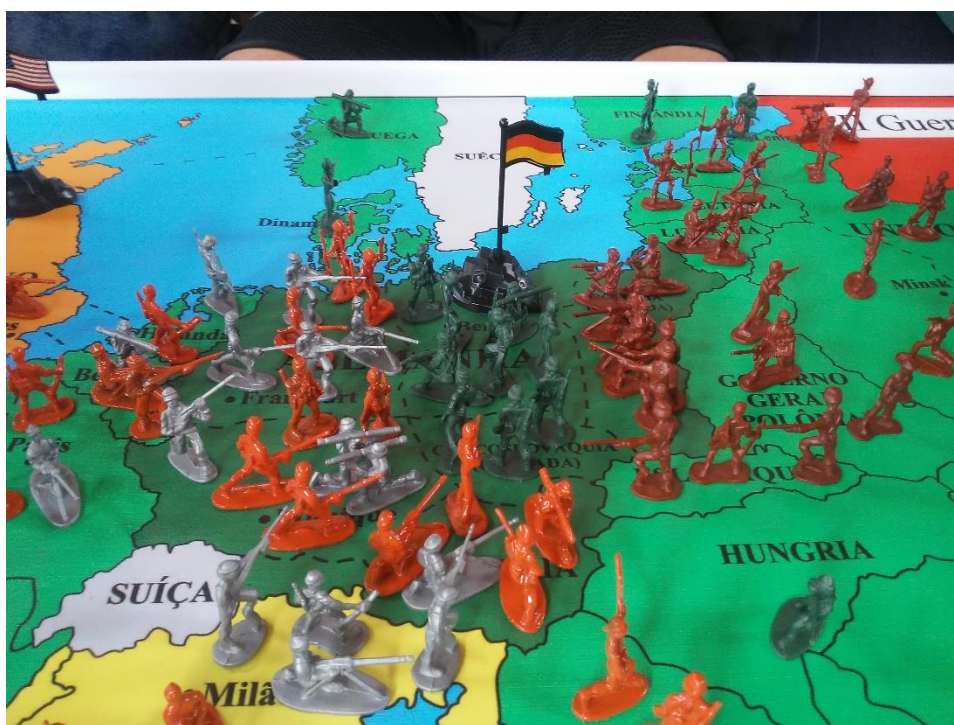
Imagem 11: O jogo imitando a História: a Alemanha cercada ao final da guerra.

Através do jogo, alguns pontos fundamentais do conteúdo, como o Dia D e as dificuldades da Alemanha em se lutar em várias frentes puderam ser analisados pelos próprios alunos pela comparação a uma atividade prazerosa e em conjunto com seus colegas, algo que não teria acontecido com a mesma facilidade no caso de informações passadas por exposição oral em sala de aula ou leitura de livro didático. A própria atividade do jogo foi uma produção de conhecimento na qual os alunos foram agentes ativos – através da atividade lúdica, da interação entre diferentes decisões e da aleatoriedade do jogo, os alunos puderam construir a contrafactualidade e utilizá-la para comparação com a História, e assim atingir os objetivos propostos. Ademais, o engajamento na atividade e as questões mais simples da avaliação estimularam os alunos a pesquisar sobre o assunto.