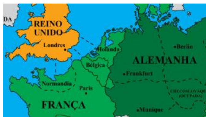
Imagem 9: Detalhe do mapa do jogo na região de possíveis invasões dos Aliados ao continente. Note a quantidade de traços no mar para cada local.

A situação mais evidente para se explicar através do jogo é a que aparece na questão 4, o Dia D. Lembrando que, pela regra do jogo relativas a ataques pelo mar, o avanço da Grã-Bretanha para a França sofre um redutor de 1 ponto através do Canal da Mancha, 2 pontos pela Normandia ou Bélgica, e 3 pontos pela Holanda. Como já foi explicado anteriormente, essa regra foi criada para aproximar ao máximo o jogo das situações e dilemas vividos na Segunda Guerra Mundial.