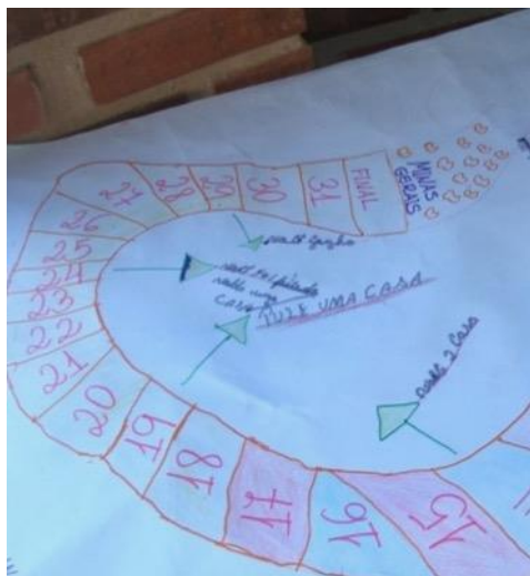
Imagem 1: Jogo de tabuleiro simples em cartolina.

Aponto como uma última categoria de jogos passíveis de obterem bons resultados quando usados para o ensino os jogos de representação tradicionais, diferentes do RPG por não contarem com a aleatoriedade – a categoria Mimicry de Caillois. O mais óbvio exemplo desse tipo de atividade são as peças de teatro, mas para se trabalhar conteúdos escolares de História, já pude organizar olimpíadas semelhantes aos jogos olímpicos gregos da Antiguidade e a produção de armaduras de cavaleiros medievais com caixas de papelão. Nesse caso, o intuito foi demonstrar alguns motivos pelos quais a nobreza detinha o monopólio de fazer parte desse grupo – a começar pela necessidade de se ter alguém exclusivamente para ajudar o cavaleiro a vestir a armadura, um escudeiro (nenhum aluno conseguiu vestir a armadura sozinho).