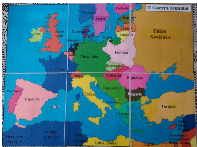
Imagem 4: Mapa encontrado na internet traduzido. 3

Para a versão utilizada como produto do Mestrado, houve algumas mudanças. Foi escolhido como cenário a mesma localização geográfica, porém em momento distinto. O atual tabuleiro representa a divisão política no final do ano de 1942, momento no qual o Eixo ainda apresentava um grande domínio da situação da guerra, mas começava a demonstrar sinais de retrocesso e sérias dificuldades. Tropas alemãs, apoiadas por italianos e romenos, estagnaram na tentativa de capturar Stalingrado, último foco de resistência antes que o Eixo capturasse as reservas de petróleo soviéticas do Cáucaso. No norte da África, os exércitos dos Estados Unidos e Reino Unido obtiveram sucesso na Operação Tocha, capturando quase todo o território, antes ocupado pelo Eixo, com exceção apenas de partes da Líbia e Tunísia, ainda defendidas por um contingente reduzido comandado por Rommel. O final do ano de 1942 foi escolhido como ponto de partida do jogo por ser um momento crucial para seu desenvolvimento, no qual mudanças de determinadas decisões poderiam ter afetado radicalmente seu resultado.