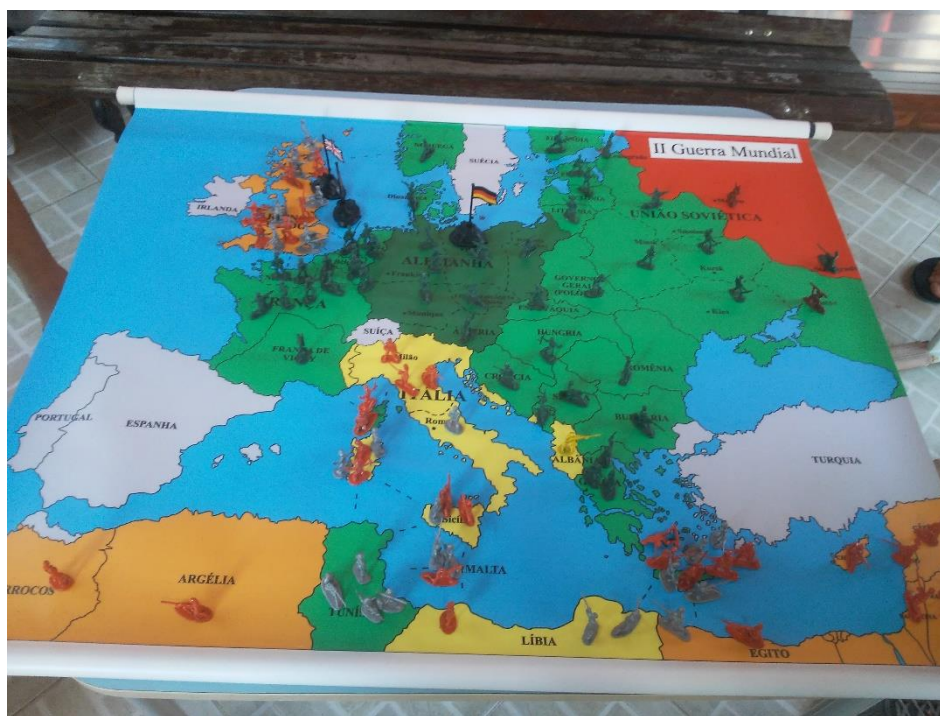
Imagem 12: História contrafactual: a Alemanha derrota a União Soviética.

Ao jogar a segunda partida com a turma de 2019, tivemos a ideia – eu em conjunto com os alunos – de fazermos uma nova partida com objetivos um pouco diferentes. Seria uma tentativa de se trabalhar o conteúdo do mundo polarizado do pós-guerra. A condição de vitória seria um pouco diferente: ganharia o jogo quem tivesse o maior número de territórios controlados ao final. Com isso, buscaríamos reproduzir o cenário do final da guerra, já com a corrida por influência entre os blocos capitalista e comunista, trabalhando com a contrafactualidade da mesma forma que na versão anterior. Contudo, ironicamente o grupo que jogou com o exército alemão conseguiu dessa vez conquistar Stalingrado e derrotar a União Soviética; não houve a invasão da Europa pela França, pois os jogadores do exército aliado resolveram concentrar os esforços na invasão da Itália. Foi preciso mais uma tentativa para que o novo objetivo pudesse ser trabalhado.