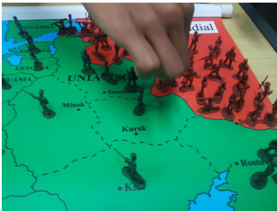
Imagem 10: O front oriental em plena atividade.

O resultado do jogo, com ambas as turmas, foi a vitória dos Aliados, com a União Soviética conquistando Berlim. Diferente da atividade anterior, dessa vez eu solicitei aos alunos que respondessem individualmente, caso houvesse discordância entre as percepções dos membros dos grupos.