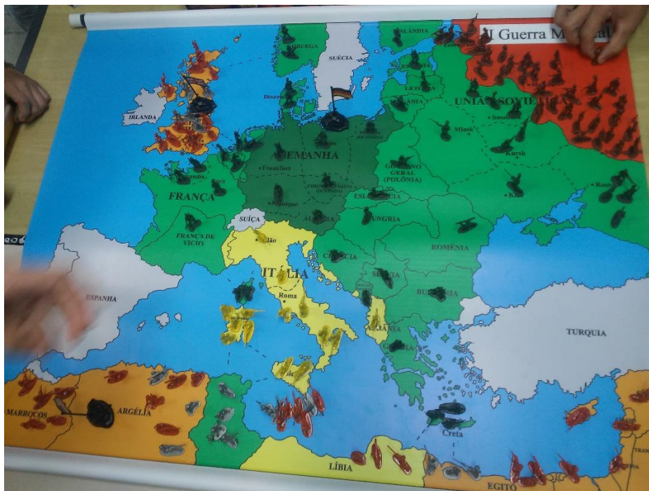
Imagem 7: Uma partida em desenvolvimento.

Uma primeira experiência ocorreu no ano letivo de 2018, após aulas expositivas e exercícios escritos sobre a Segunda Guerra Mundial, para adequada contextualização e posterior cumprimento dos objetivos propostos. No ano letivo de 2019, houve uma segunda experiência com a nova turma do nono ano da escola. Optei por manter a mesma estratégia do ano anterior: duas partidas com as mesmas questões e temáticas, com o objetivo de produzir uma amostra maior de resultados da mesma atividade, bem como melhorá-la em alguns pontos.