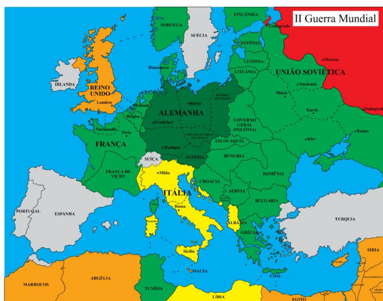
Imagem 6: Mapa editado por designer gráfico e revisado pelo autor.