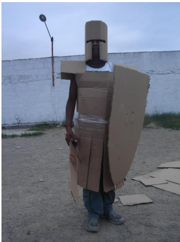
Imagem 2: Jogo de representação.

Independente da particularidade de cada tipo de jogo que se pode utilizar como recurso no ensino de História nas escolas, todos eles contam, antes de qualquer outra coisa, com o apelo à ludicidade em si, o que foi discutido no capítulo anterior. No próximo capítulo, apresento o produto dessa dissertação, resultado de todos esses anos de atividades lúdicas em minha carreira e produzido com base nas reflexões sobre o jogo (de modo geral) apresentadas anteriormente e em bases teóricas específicas da História, que serão discutidas adiante.