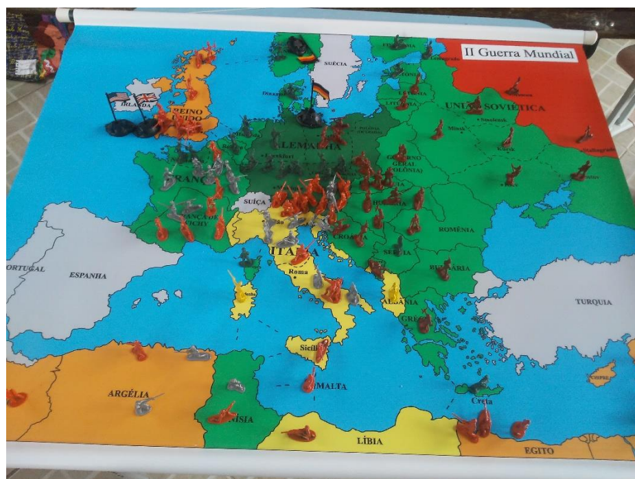
Imagem 13: O jogo reconstruído com os alunos: abordar a questão do pós-guerra e o mundo polarizado.

Ao final dessa última partida, a União Soviética conseguiu conquistar Berlim, porém antes capturou quase toda a Europa Oriental, exatamente como ocorreu na Segunda Guerra Mundial, e venceu a partida pelo número de territórios. Por outro lado, Inglaterra e Estados Unidos dominaram o norte da África e entraram na Europa pela Itália, coincidindo também com a História. Entretanto, não houve a invasão da França pelo norte do país, tendo os alunos se concentrado no caminho pela Itália.